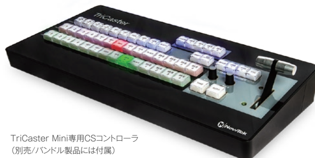
TriCaster Mini専用CSコントローラ (別売/バンドル製品には付属)