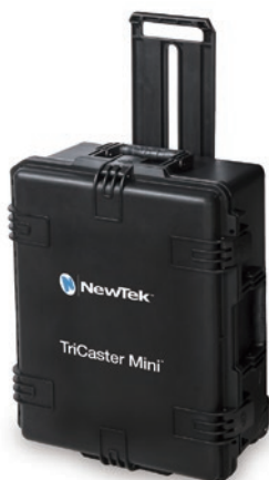
キャリングケース (バンドル製品には付属)

TriCaster Miniは、単にコンパクトな筐体でシンプルな操作だけを提供するシステムではありません。スタジオで必要とされるほとんどの機能が搭載されているため、非常にクオリティの高い映像を制作、収録・配信できます。